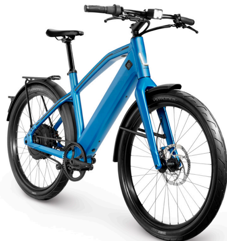
Stromer Amsterdam Double Bag 30 l